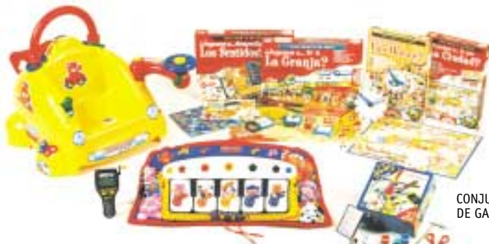
CONJUNTO DE GANADORES