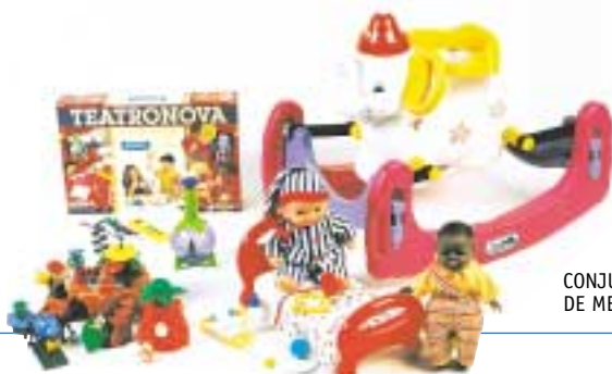
CONJUNTO DE MENCIONES

En esta 34ª edición, un total de 46 empresas han presentado 197 juguetes. Un total de 1.200 niños y niñas, así como 80 familias, han participado en el proceso de valoración y selección de los juguetes.