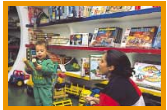
Los padres participan en las actividades lúdicas con sus hijos.